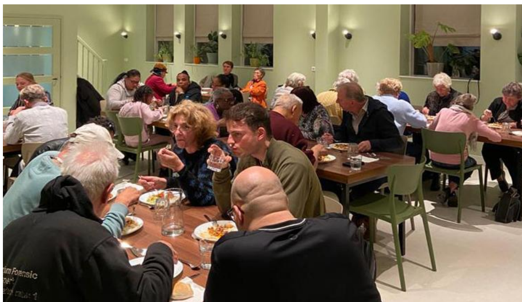
Een brede groep mensen weet de wijkmaaltijd te vinden.

In het wijkrestaurant wordt twee keer per week een goede en verse maaltijd gekookt voor wijkbewoners. Een maaltijd voorziet in een eerste levensbehoefte en samen eten zorgt bovendien voor gezelligheid en saamhorigheid. We helpen op deze manier mensen die krap bij kas zitten of moeilijk rond kunnen komen, want de financiële bijdrage is vrijwillig en op basis van persoonlijke mogelijkheden. Het streven is een minimum bijdrage en soms wordt er iets meer betaald, wat een deel van de algemene kosten dekt.