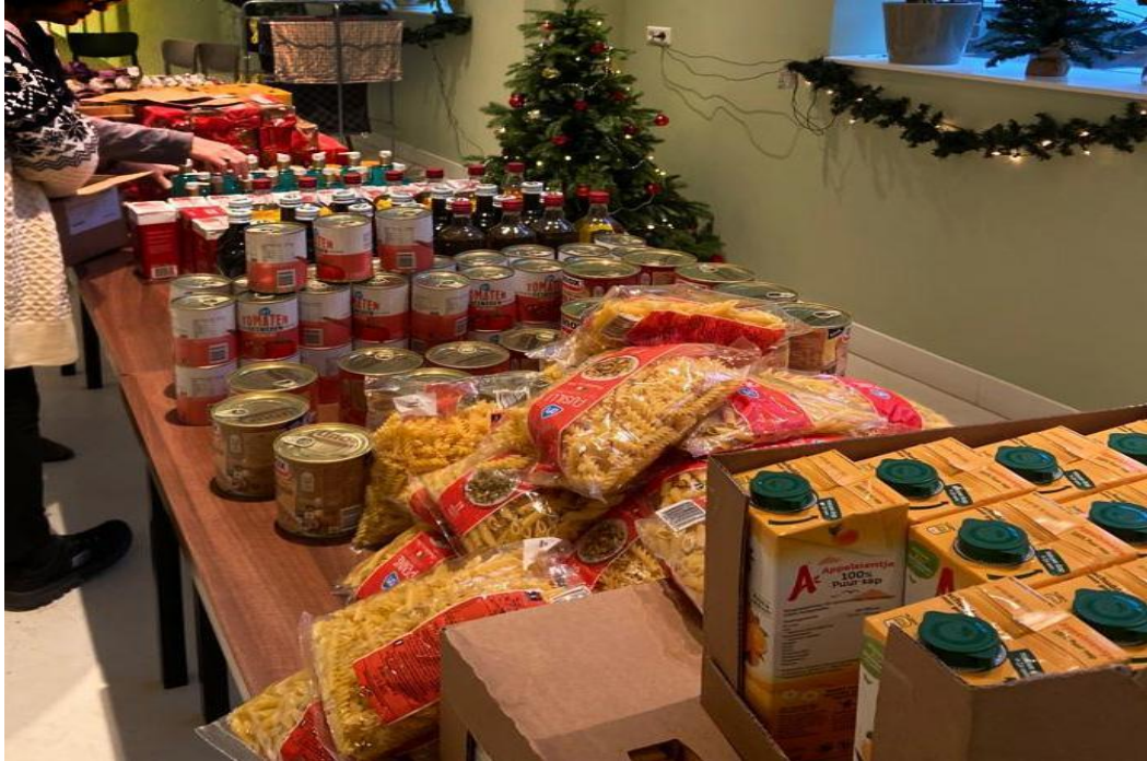
Voedselhulp blijft nodig en rond feestdagen kunnen we met veel hulp wat extra's doen.

Met financiële hulp kunnen bewoners refurbished laptops aanschaffen ter ondersteuning van de computerlessen die zij bij Thuis in Charlois volgen.