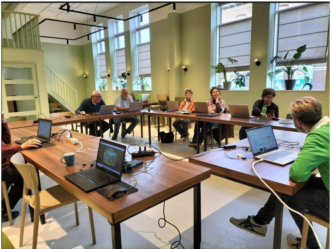
Computercursus op de eigen laptop

Naast de kennisoverdracht speelt de sociale kant een belangrijke rol. Elkaar ontmoeten en contact hebben is zeker zo belangrijk. Daarom worden de meeste cursus uren afgesloten of gestart met een gezamenlijke lunch.