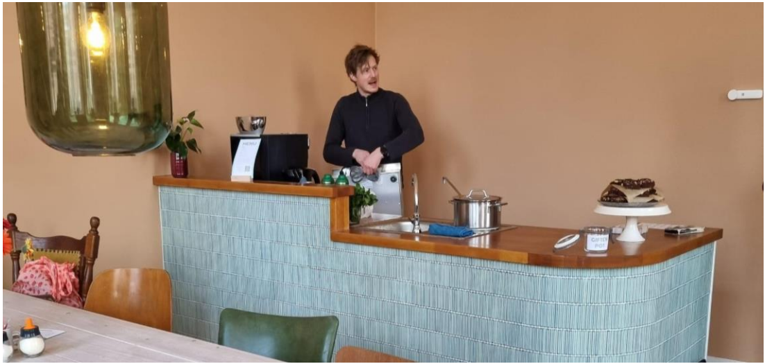
De koffiebar in de huiskamer