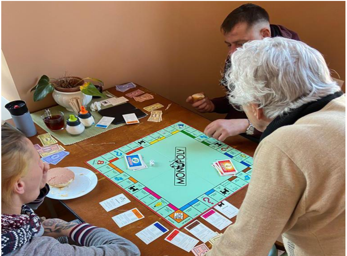
Samen een spel spelen valt bij jong en oud in de smaak!

De huiskamerochtenden en ook de hierna beschreven computercursussen worden gecombineerd met een gezamenlijke lunch. Er is altijd een vrijwilliger bereid om een lekkere pan soep te maken. En door die ontmoetingen leren mensen elkaar beter kennen.